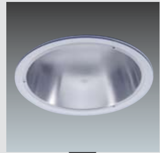
Kit IP44 opale