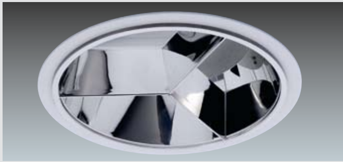
Grille croix 3 cellules